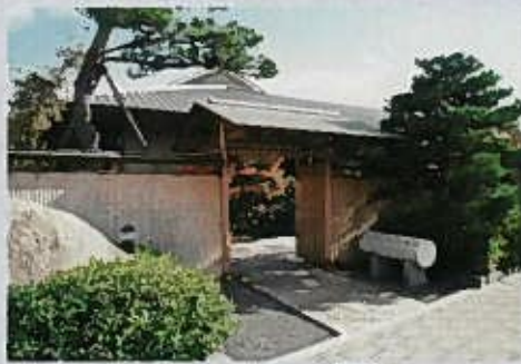
庭園は、谷崎の関西での最後の住居・京都湯渡亭の庭を模したものの