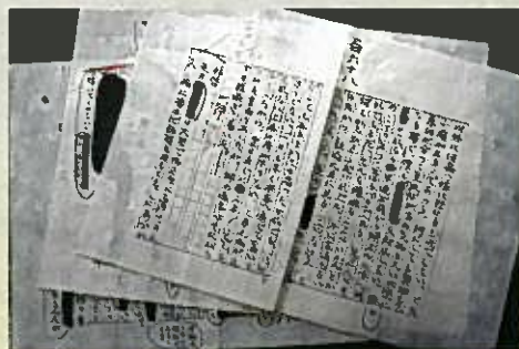
谷崎自筆の「細雪」原稿（毛筆）