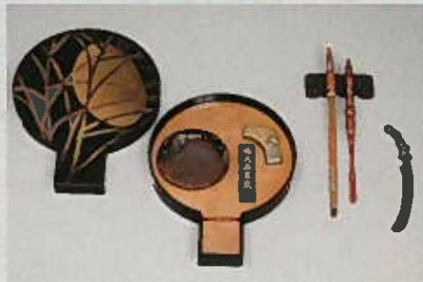
谷崎潤一郎愛用の硯など