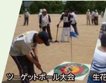
ターゲットボール大会

詳しくは ☎(0797)32-7558 (老人クラブ連合会事務局)までお問い合わせください