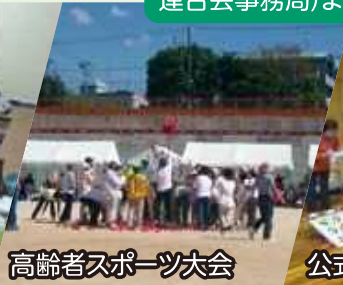
高齢者スポーツ大会