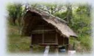
国指定史跡会下山遺跡

三条町にある会下山遺跡は平成 23 年（2011 年）2 月に国指定史跡に指定されました。弥生時代（約 2,000 年前）の高地性集落跡として、考古学の世界では全国的に有名です。