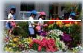
学校園花いっぱい活動

*オープンガーデンの開催とともに、学校園などの公共施設に緑化資材の配布や、緑化活動に取り組んでいる団体に活動助成をするほか、団体間の交流を進めています。