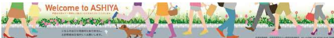
J R 芦屋駅構内に設置した市民マナー条例啓発パネル（制作：神戸芸術工科大学）