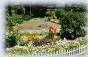
*オープンガーデン

『芦屋庭園都市』の実現に向けて、5つのアクションプログラムを策定し実施しています。その1つとして、*オープンガーデンの充実も掲げており、市民の方々とともに開催し、実施から10年目を迎える平成27年度（2015年度）は107の個人・団体の参加がありました。