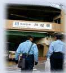
市民マナー条例指導員

過料処分者は平成 23 年度（2011 年度）で 467 件ありましたが、平成 26 年度（2014 年度）では 208 件まで減っています。