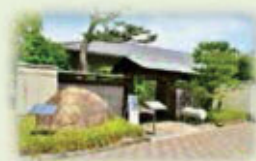
谷崎潤一郎記念館