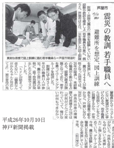
平成26年10月10日 神戸新聞掲載