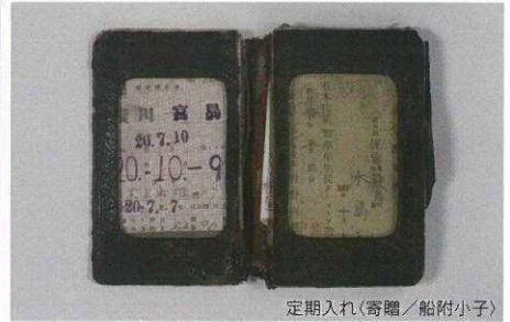
定期入れ(寄贈/船附小子)

「こんな思いを他の誰にもさせてはならない」という被爆者の切なる思いを聴き、核兵器廃絶と世界恒久平和の実現に向け、新たな一歩を踏み出す機会となることを心から期待しています。