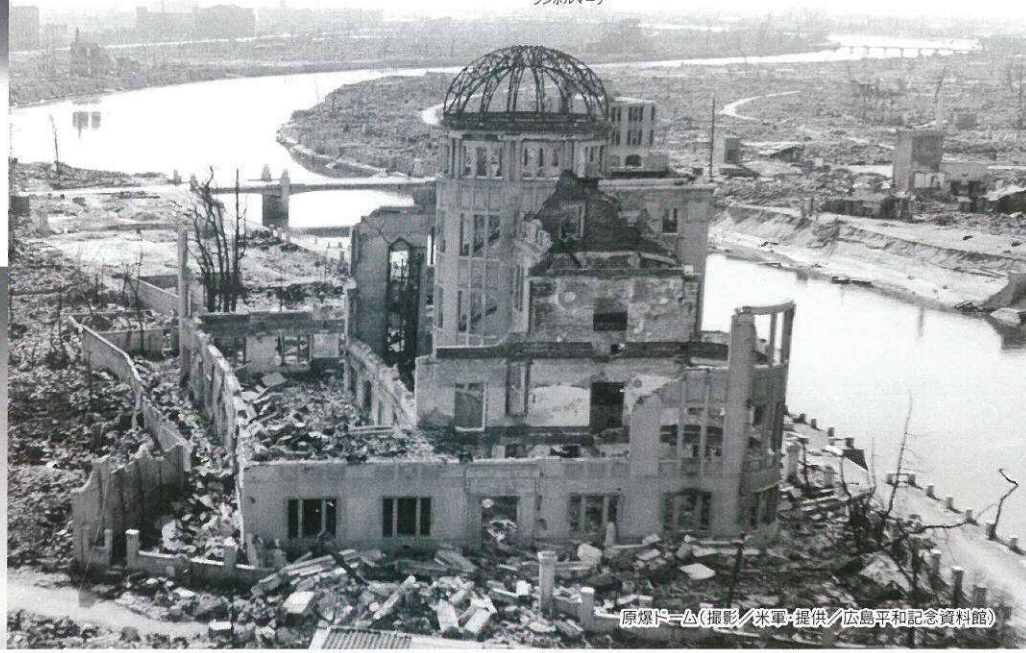
原爆ドーム