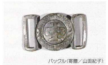
バックル(寄贈/山田紀子)