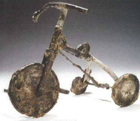
伸ちゃんの三輪車(奇贈/鉄谷信男)