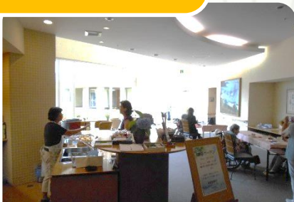
『カフェのお手伝い』