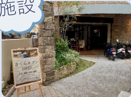
『カフェのお手伝い』