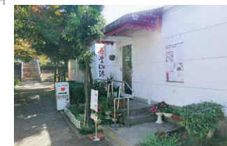
文化ゾーン内のカフェ