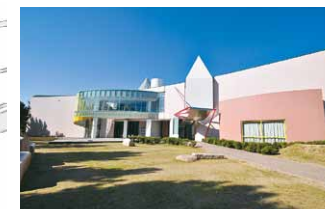
谷崎潤一郎記念館