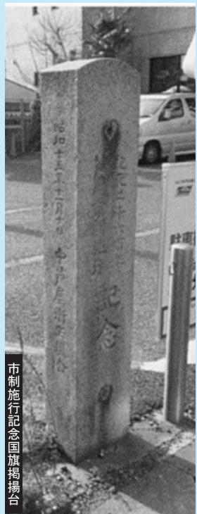
市制施行記念国旗掲揚台

旧芦屋市保健センター(現在の芦屋市役所公光分庁舎)の敷地南東部に残されている国旗掲揚台の対となる石柱の片方です。この石柱には、昭和15年(1940)の市制施行と、同年の皇紀2600年の記念について記されています。