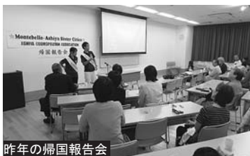
昨年の帰国報告会

第51回モンテペロ市学生親善使節が7月27日から8月18日の3週間、モンテペロ市内に滞在し、市長表敬訪問や二世パレードなど、さまざまな交流事業に参加してきました。その帰国報告会を下記のとおり開催しますので、姉妹都市交流や学生親善使節に関心のあるかたは、お気軽にご参加ください。