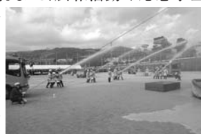
平成27年芦屋市消防出初め式一斉放水演技

芦屋市消防団では、男女を問わず新入団員を募集しています。 ■内容 定期的な訓練や研修・災害時の活動。また、広報活動や応急手当普及員の資格取得後、地域で行われる防災訓練等での指導。 ■対象 18歳以上50歳未満で市内に在住または在勤のかた ■待遇 市条例に定める年報酬の支給。災害出動および各種訓練参加に対し手当等の支給。制服貸与・公務災害補償・表彰等の制度あり。