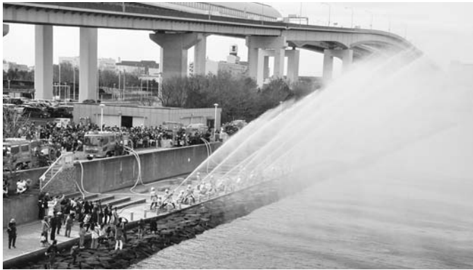
「平成28年 芦屋市消防出初め式」を開催 1月10日(日)、総合公園北駐車場を会場に、式典および初期消 火・救急救助・一斉放水訓練等を披露しました。

発行/ 芦屋市役所(広報国際交流課) TEL.0797-31-2121/FAX.0797-38-2152 〒659-8501兵庫県芦屋市精道町7番6号 ホームページ http://www.city.ashiya.lg.jp/ メールアドレス info@city.ashiya.lg.jp