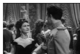
アンナ・カレニナ