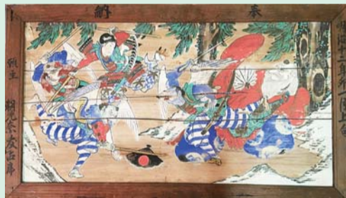
岩園天神社絵馬 牛若丸鞍馬山修行之図 (芦屋市立美術博物館蔵) 明治12(1879)年

■日時 4月15日(土)・30日(日)両日とも午後2時～3時 ■会場 展示室 ■内容 本展担当学芸員による展示解説 ■参加費 要観覧料