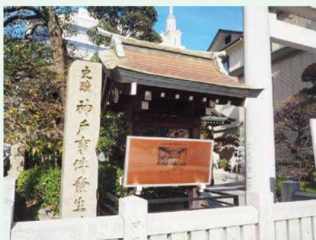
三宮神社に建つ「史蹟神戸事件発生之地」石碑

以上のように、神戸港開港に伴い神戸事件が起こりましたが、この歴史的な事件のひとつの舞台として芦屋は深く関わっていたのです。