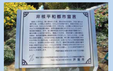
非核平和都市宣言銘板 (市役所北館前広場)

被爆72年を迎える広島・長崎では、原爆死没者の慰霊と平和祈念の式典が行われ、黙とうがささげられます。市民の皆さんも、1分間の黙とうにご協力をお願いします。