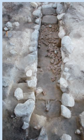
双龍環頭大刀のみつかった古墳

八十塚古墳群は、芦屋市東部朝日ヶ丘町・六麓荘町・岩園町)と西宮市西部(苦楽園四・五・六番町)に広がる古墳の集まり(II群集墳)で、古墳時代の終わりで、約1400~1500年前のものが多い。「八十」には、数が多いことを示す意味があります。その名の通り100基くらいの古墳があったと考えられています。