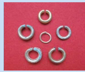
アクセサリーの金環

さて、古墳からは、さまざまな副葬品などがみつかります。八十塚古墳群でも、今年3月に市指定文化財となった双龍環頭大刀や、アクセサリーの金環などがみつかっています。ここではほんの一部しかご紹介できませんが、只今開催中の「古墳時代の芦屋」展では、市内の古墳や遺跡