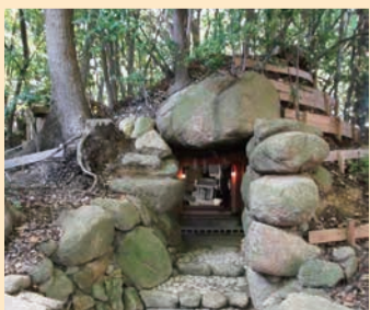
芦屋神社境内古墳