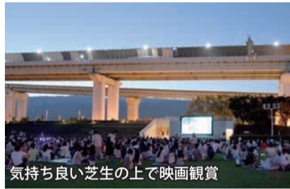
気持ち良い芝生の上で映画観賞