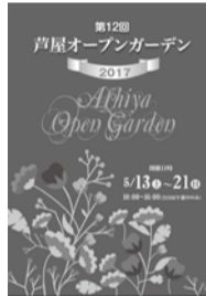
昨年のパンフレット