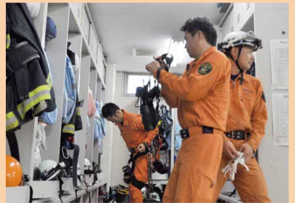
救助用具などを着用