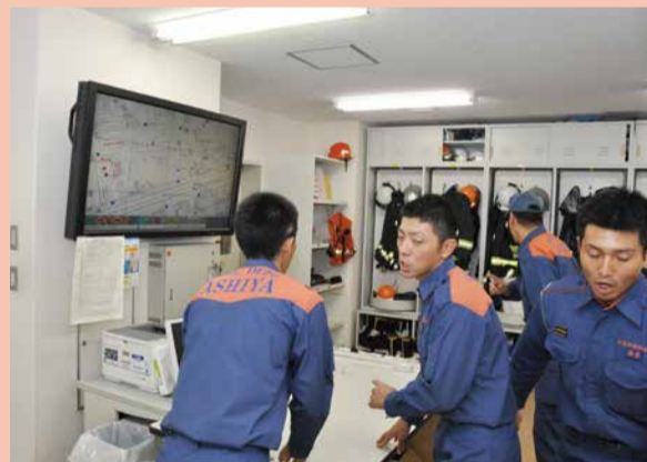
指令の情報を確認し、場所や必要な装備の確認