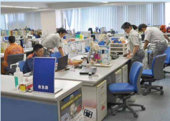
執務室に指令の放送が流れ、準備開始

通報のほぼ大部分を占めています。一刻を争う急病人やけが人の生命を救うため、迅速に対応します