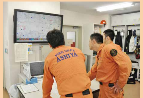
指令の情報を確認し、場所や必要な装備の確認