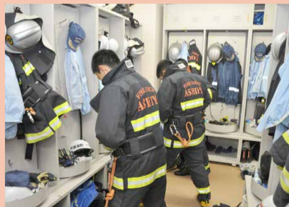
防火服などを着用