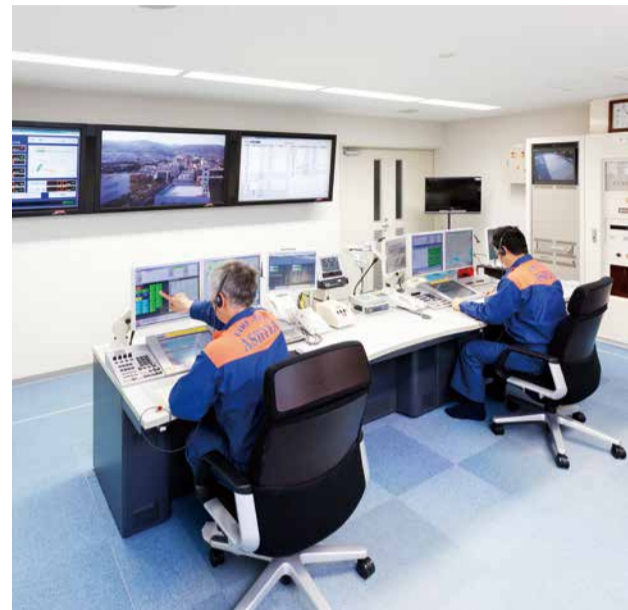
119番通報を受信する通信指令室

119番の通報を受信すると、指令室の通信員が対応します。通報のあった場所や、けが人・急病人などの状況、現場の状況などの内容を聞き取り、救急・火災・救助の必要な隊へ指令を出します。