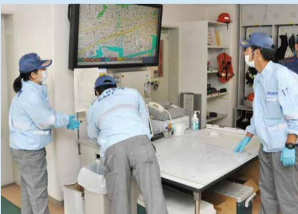
装備の準備、場所や対象者の症状の確認