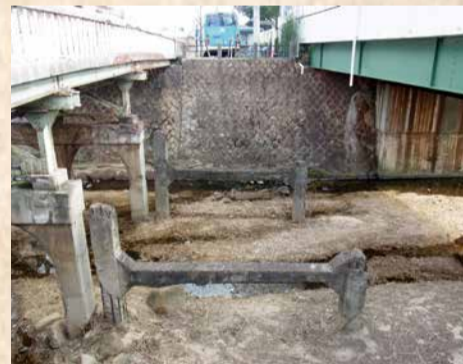
損壊した橋脚部だけが残る初代桜橋

初代の桜橋は阪神大水害によって損壊しましたが、現在、その橋脚の下部だけが川底に残っています。市内には、阪神大水害の痕跡はほとんど残っておらず、大変貴重な災害遺構と言えます。