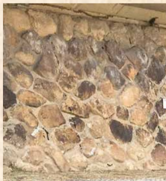
水害以前の石垣が残る西岸