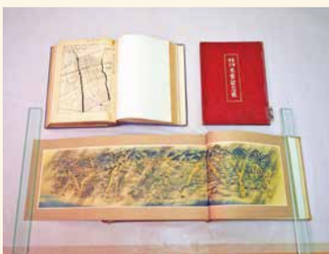
阪神大水害の関連資料