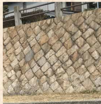
切石で積み替えられた東岸の石垣

芦屋川の開森橋から月若橋の間で、芦屋川の両岸の石垣をよく見ると、東岸側が切石で、西岸側が自然石を積み上げて築かれていることがわかります。その理由は、堤防の損壊が大きかった東岸側だけが石垣を積み替えられ、被害の少なかった西岸側は水害以前の石垣(昭和4~5年築)がそのまま残っているからです。