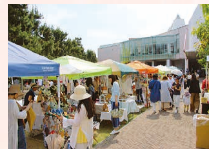
賑わう手作り市(2018年秋)