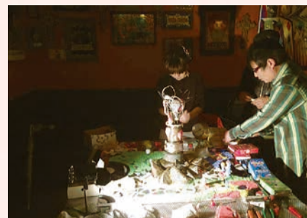
みんなでワークショップ(2018年秋)