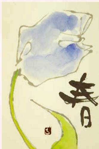
こころ温まる絵手紙