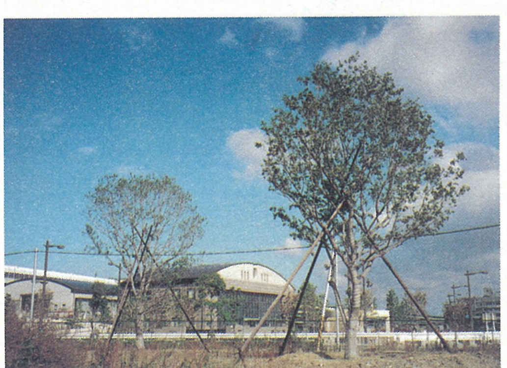
神戸ゾントラクラブと国際ソロプチミスト芦屋から寄贈されたシンボルツリーの「エノキ」

また、公園の維持管理についても、市民の皆様のご協力をいただきながら進めていきたいと考えています。 なお、これらの具体的な内容につきましては、今後とも随時お知らせしますので、ご理解とご協力をよろしくお願いいたします。