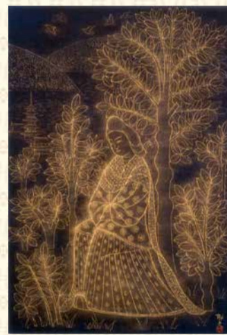
平山郁夫《額田王》平成9(1997)年