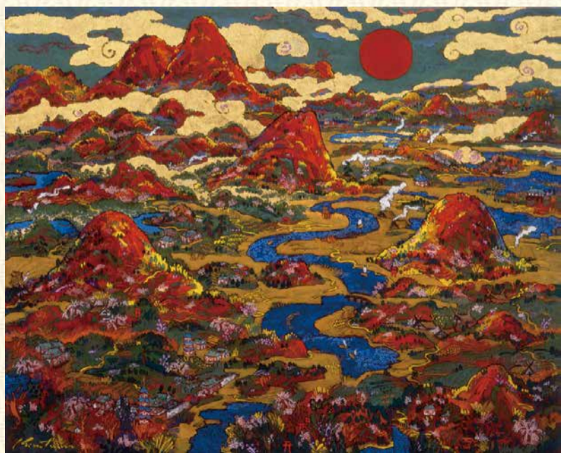
絹谷幸二《大和国原》平成9(1997)年