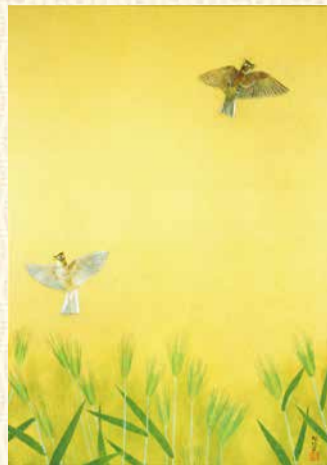
上村松篁《春愁》平成10(1998)年