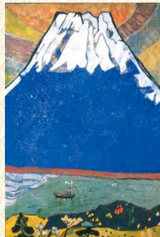
片岡球子《富士》平成10(1998)年