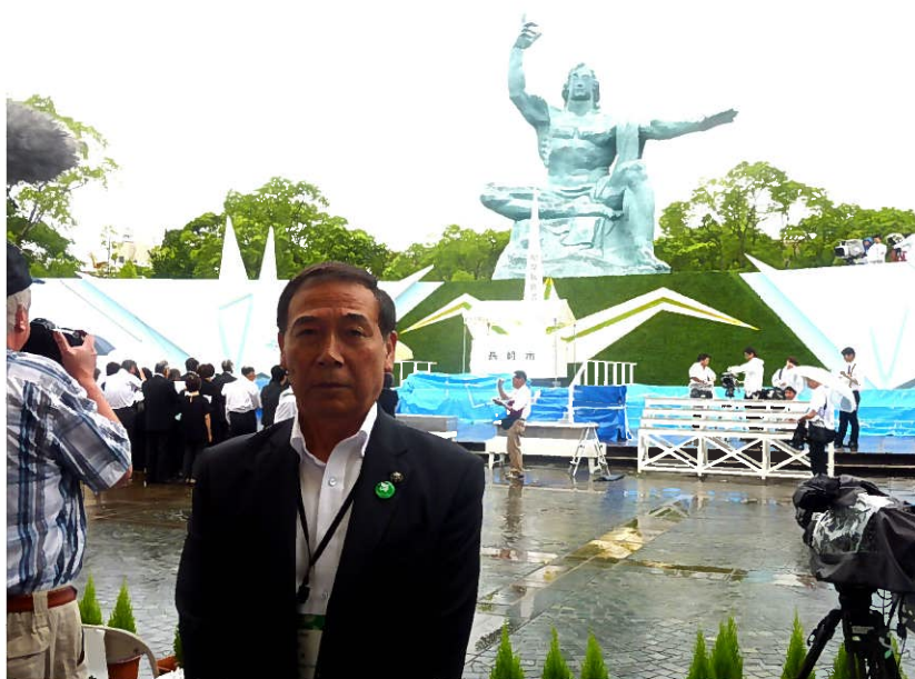
(平和祈念式典 平和公園にて)