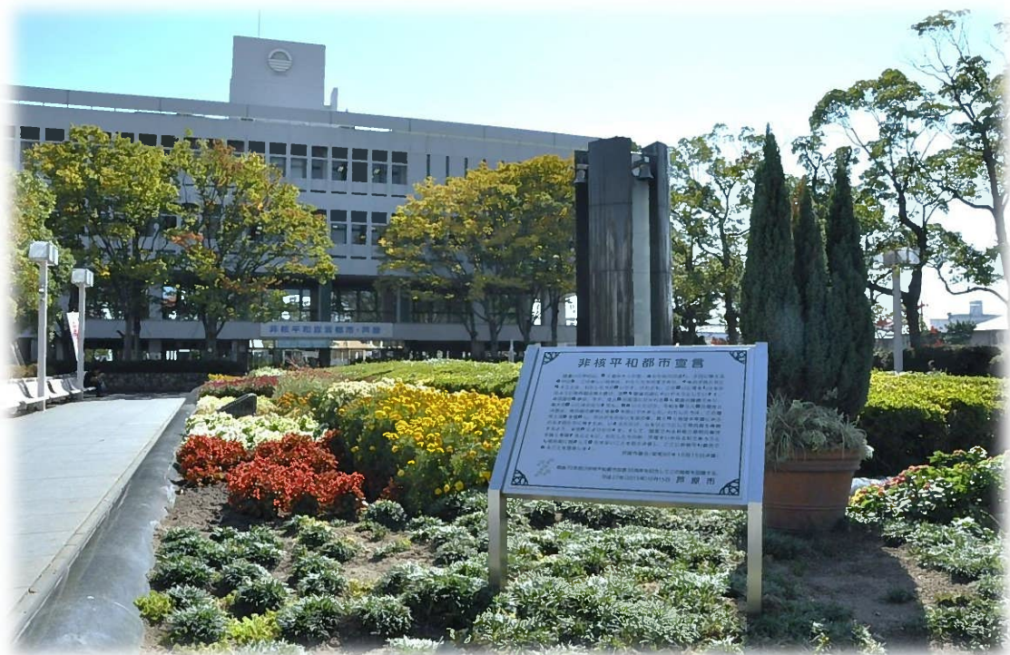
戦後 70 年・非核平和都市宣言（芦屋市議会）30 周年記念銘板