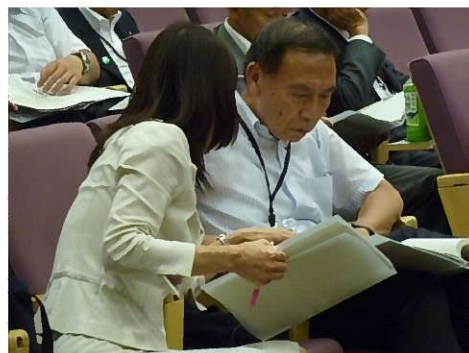
(第9回平和首長会議総会にて)