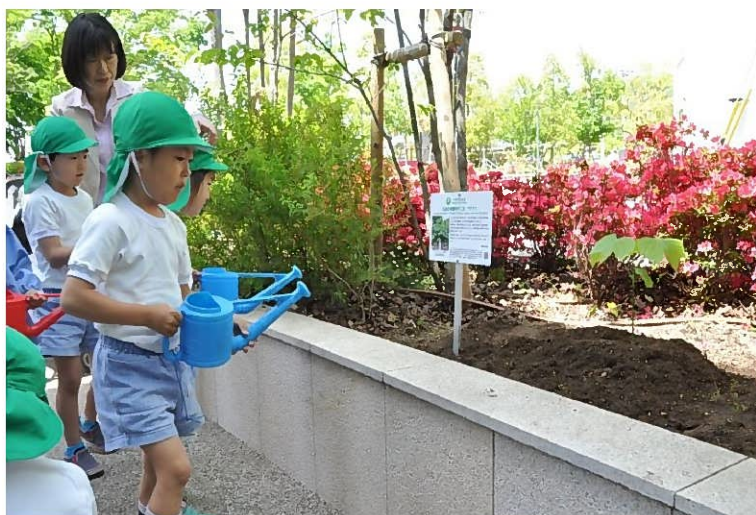
(被爆樹木アオギリ2世植樹 芦屋市役所本庁舎東館北側緑地にて)