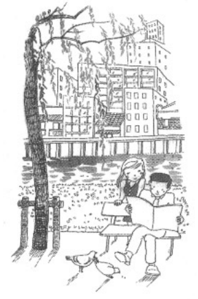
…質問 A …答弁

十二月定例会では、十二月九日（火）、十日（水）、十一日（木）の三日間、十四人の議員が市政に関する二十九項目の内容について、通告順に質問を行いました。その一部を紹介いたします。