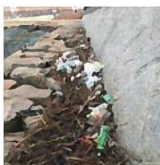
芦屋川の海浜ゴミ

市 芦屋川河口のゴミ対策については、市民・県・市の三者でゴミの回収方法を含めたルールづくりを協議していく。海浜ゴミの仮置き場については、芦屋川河口に隣接している市有地の活用を検討している。