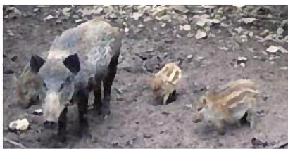
市街地に出没するイノシシ

イノシシ対策については、現在、山林から住宅地への出没ルートに箱わなを設置し、猟友会による見回りを毎日実施するなど、被害防止に努めている。今後、近隣市と広域的な一斉捕獲の取り組みについて協議していく。