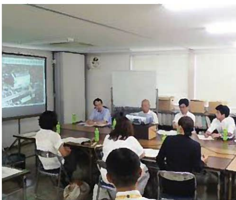
浦和駅周辺まちづくり事務所