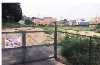
その後、入札中止となった東芦屋町の市有地

代替用地については、土地開発公社解散時に策定した計画に従い、一般競争入札により売却し、その収入を基金に積み戻すこととしている。