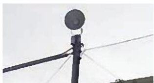
グラウンドの照明は簡易照明設備で十分(川西グラウンド)

教委 学校体育施設は、各小学校ではコミスクなどに開放しており、中学校では、潮見中学校で体育館の一部を開放している。他の中学校施設においても、教育委員会、学校、利用者団体等の三者で十分に協議していきたい。夜間照明は、潮見小学校では夜間の校庭開放の際に使用しているが、その他の学校施設については、近隣住民の理解が得られないため、整備は困難な状況になっている。