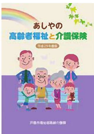
あしやの高齢者をサポートするガイドブック

市 新総合事業はスタートから1年を経過した時点で評価の仕組みを含め公表していく。特別養護老人ホームは、潮見圏域での増設を予定しているが、事業者からの応募に至っていない。今後も介護保険事業計画に基づき施設整備を進めていく。