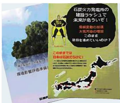
石炭火力発電の事業者資料(左)と問題を指摘する市民団体の資料(右)

市 石炭火力発電は、温室効果ガスの排出量が大きいという問題があるものの、安定供給性、経済性に優れた重要な電力源として必要であるため、高効率化を図り環境負荷を低減しつつ活用していく方針を国が示していることから、今後、環境影響評価法に基づいた手続きが行われるよう、市として環境保全の見地から準備書への意見書を県に提出していく。