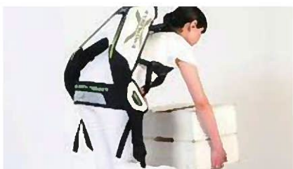
装着者の腰負担を軽減するマッスルスーツ

介護ロボットは、平成28年度に国の補助金を活用し、移動支援装着型ロボットの腰補助用マッスルスーツを1施設に、見守り支援システムを2施設に導入支援した。現在のところ、補助制度など市独自の支援策の実施は考えていないが、国の介護現場のニーズを反映したロボット開発の状況や介護業務の効率化・負担軽減効果の検証を踏まえ、研究していく。