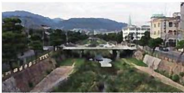
きれいな空気・環境を守りたい

石炭火力発電は安定供給性、経済性に優れた重要な電力源として必要であるため、高効率化を図り環境負荷を低減しつつ活用していく方針を国が示している。今回の増設計画による本市への影響は、市民生活にとって重要であるため、10月31日に環境審議会で答申をいただき、市の考えをまとめ、11月15日までに環境影響評価準備書への意見書を県へ提出する予定としている。