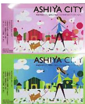
市民マナー条例の啓発マグネットシート(春と夏バージョン)