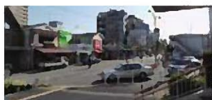
再開発事業が進むJR芦屋駅南地区

JR芦屋駅南地区の再開発事業は、住宅・商業・公益・交通の機能向上を目指した施設整備を行い、本市の南の玄関口としてふさわしいまちとしての魅力を高めることで、人口減少や少子高齢化対策にも寄与するものと考えている。