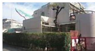
認定こども園が計画されている精道保育所

多くの待機児童を抱える本市では、現在のところ導入は困難と考えているが、「市立幼稚園保育所のあり方」の取り組みによる待機児童の状況に応じて検討していく。