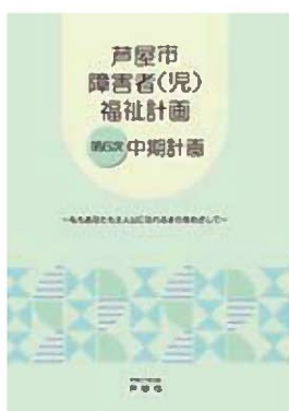
障がい者の就労を支援

市 就労支援については、平成24年度から保健福祉センターに就労支援員を配置し、県の「阪神南障害者就業・生活支援センター」と連携し進めている。平成25年度からは事業者として市が率先し、知的・精神に障がいのある人の短期雇用、チャレンジ雇用を実施している。また、新たな雇用につなげるため、現在、商工会とともに市内事業者の実態調査を実施しており、障害者雇用奨励金制度の周知を進めている。