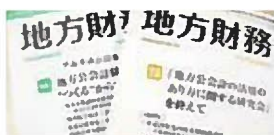
月刊地方財務2016年11月号・12月号 株式会社ぎょうせい発行