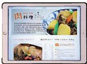
タブレットでレシピサイトを見ながら調理すれば、汚れや濡れることは気にならない

広報紙への給食レシピの掲載については、「広報あしや」に限られた紙面の中でタイムリーな情報を優先しているが、調整できる範囲で掲載していく。学校給食のレシピのウェブサイトへの掲載については、今後検討していく。本庁舎食堂での給食メニューの提供については、本市の給食を紹介する良い機会となることから、特別メニューとしての提供を検討していく。