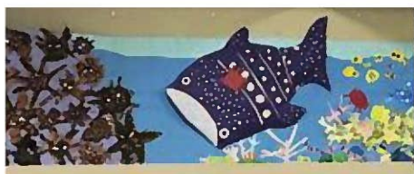
精道幼稚園に飾られている園児の作品

「市立幼稚園・保育所のあり方」についての住民との合意形成は、本年2月の公表後、地域等への説明会の実施や広報あしや臨時号の発行などにより周知を図るとともに、いただいたご意見、複数の団体からの要望書や申入書等を踏まえ、「あり方」の一部変更を行ったところである。今後も具体的な取り組みを進める中で、住民の皆さまに丁寧な説明を行っていく。