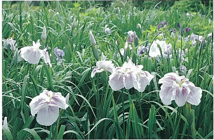
花ショウブ（西浜公園）