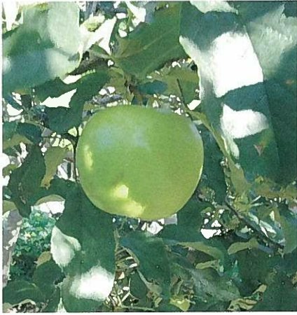
希望りんご（臨港線沿い緑地）