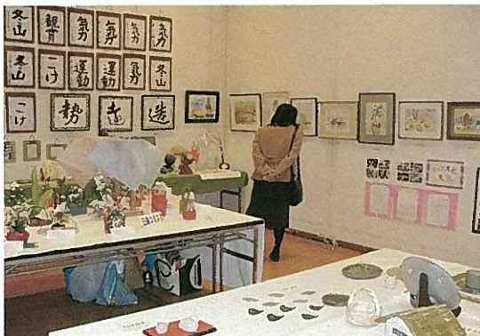
コミスク文化展 会場風景