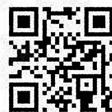
「あしや防災ネット」かんたん登録コード

登録したアドレスにメールで届く、防災情報を確認できます。ashiya@bosai.netあてに空メールまたは、下記の2次元コードを読み取るとメールアドレスが表示されますので、空メールを送信すると登録できます。