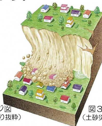
図3 がけ崩れのイメージ図 (土砂災害防止広報センターより抜粋)