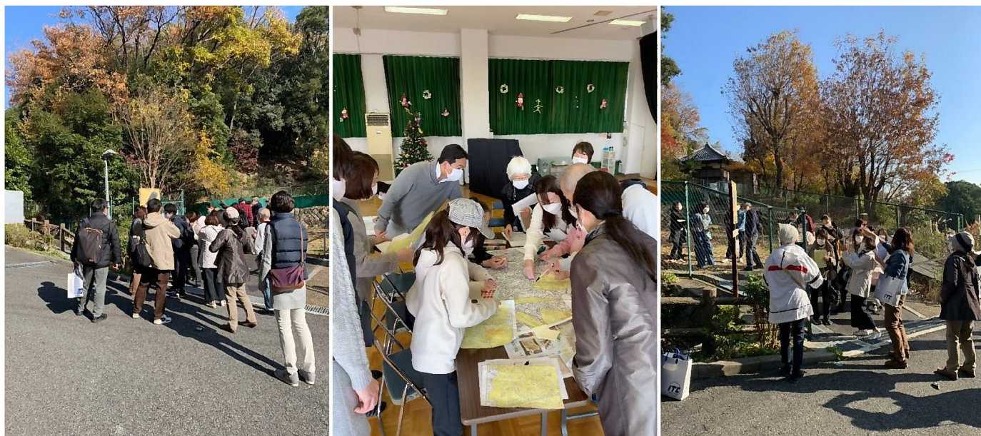
図4 三条町防災まちあるき・意見交換の様子

災害時の危険箇所はできるだけ減らしていくとともに、今後の取り組みについて地域が一丸となって進めていく必要があります。