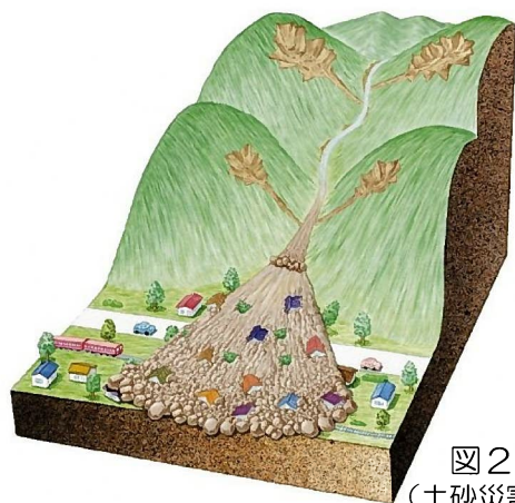
図2 土石流のイメージ図

芦屋市全域には「地すべり」の危険箇所はありませんが、芦屋市三条町には「がけ崩れ・山崩れ」と「土石流」の危険箇所が含まれていることから、「がけ崩れ・山崩れ」と「土石流」への対応が必要となります。