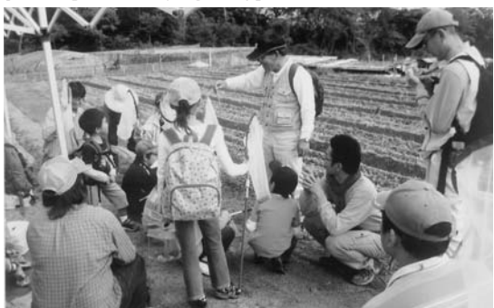
農業塾のひとコマ