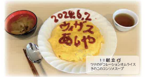
1! 献立のツナのコソメスープ

未就学児のお父さんを対象に防災料理講座を実施しました。料理のスキルを上げるとともに、防災の視点を取り入れた調理方法をお父さんに知ってもらうことで、いざという時に役立つ料理の知識を学ぶ機会になりました。