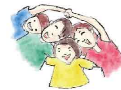
オンライン講座の様子