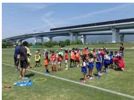
▲運動あそびプログラム

I. 本公園のメインとしてサッカー・ラグビー等に主として使用されている陸上競技場の芝生グラウンドは、適切な管理で良好なターフが形成されています。この素晴らしい芝生グラウンドを芦屋市内の幼児や園児が走ったり寝転んだりして遊べる機会をできるだけ多く作り、芝生の素晴らしさ、公園の楽しさを幼児期の心に植え付けていく取り組みを実施します。