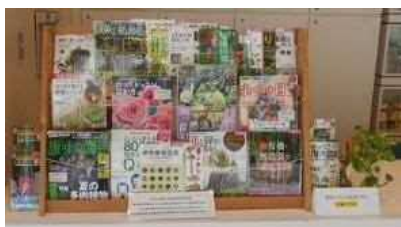
▲自由に閲覧可能な緑化専門誌

事務所内相談コーナーに在籍するスタッフは、樹木医や緑化の知識や経験を有する者を配置し、質問に対する回答は、基本は即時実施しますが、調査が必要なもの、回答に時間を要する場合には、後日電話やメールにて回答をします。園遊会やオータムフェスタ等のイベント開催時にも、緑化相談のコーナーを設置します。また緑化相談に関するQ&Aは、ファイル化し気軽に手に取って閲覧できるようにし、植物や園芸に一層関心を持っていただける機会を創出します。