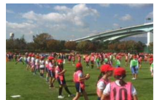
▲フラッグフットボール実施風景

関西学生アメリカンフットボール協会の協力を得て、近隣地域の小学校の高学年へフラッグフットボールの指導・普及を行い、芦屋市小学生の体力向上に繋がるひとつの取り組みとしていきます。西宮市との提携で甲子園ボウルの前座試合に出場できるように協議していきます。