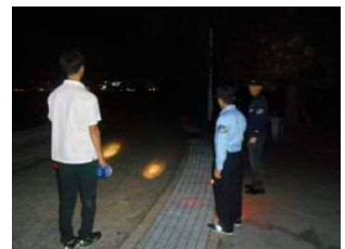
▲夜間パトロール風景

夏季にはビーチの不法利用、打ち上げ花火の使用等もあり、兵庫県・芦屋市・地域住民の方々による夜間パトロールが行われていますが、当グループも夜間パトロールに協力し、周辺地域の安全維持・治安維持の取り組みに協力していきます。