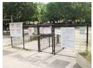
▲ドッグラン風景(イメージ)