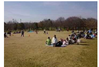
▲地域運動会の様子

本公園近隣住民の方々や、周辺自治会の方々が一緒になって楽しめる地域運動会を実施しています。近年、近所そろって楽しむような機会が少なくなっていることから、今後も子どもから大人、お年寄りまで参加できる催しとして、潮芦屋ミズノ・芦屋市体育協会と共に取り組んでいきます。