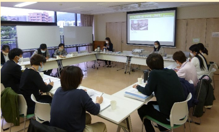
リードあしやとの意見交換会 R2.10.19

今年度は、社会参加にかかわる関係団体とのネットワークづくりを目標にして、シルバー人材センター、リードあしや、コープこうべ、社会福祉協議会ボランティア活動センターに、生活支援体制整備事業の周知を行うとともに、各団体の事業内容や取り組みについて説明していただきました。協働して取り組めることがないか、お互いの事業活動を補完強化できる取り組みの可能性について意見交換をしました。