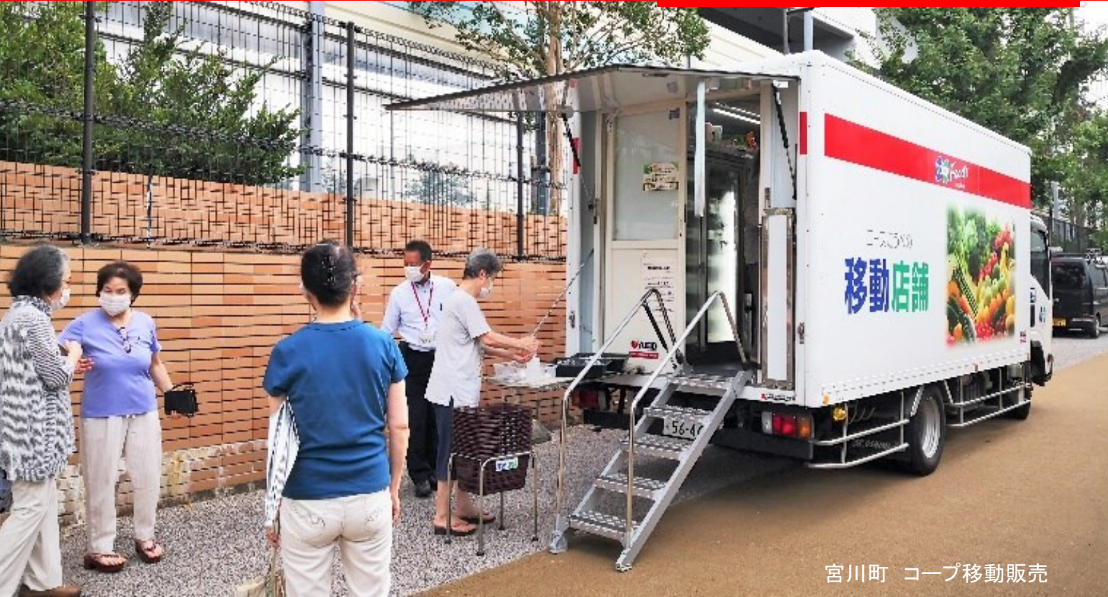
宮川町 コープ移動販売

発行者 芦屋市地域支え合い推進員 事務局 芦屋市社会福祉協議会 (芦屋市保健福祉センター内) TEL 0797-34-6711 FAX 0797-31-0674