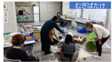
3世代交流の居場所 @コープデイズ芦屋 組合員集会所