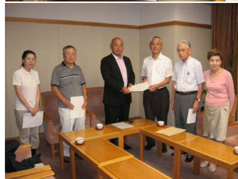
市長、副市長への要望書提出（上） 市議会議長への申入書提出（下）