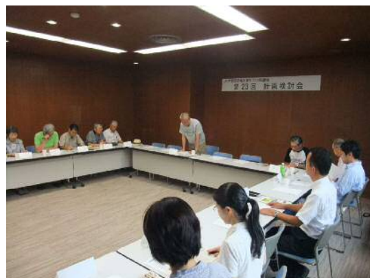
第 23 回計画検討会の様子

今後は、今回確認したまちづくりのコンセプトに加え、交通機能やすでにとりまとめた「まちづくり方針（案）」も踏まえ、検討を進めていきます。