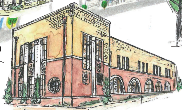
⑤旧芦屋郵便局電話事務室 (芦屋モノリス) →P.20~