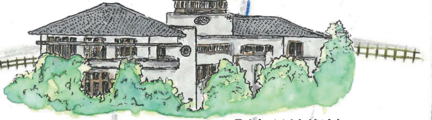
②滴翠美術館 (旧山口吉郎兵衛邸) →P.28~