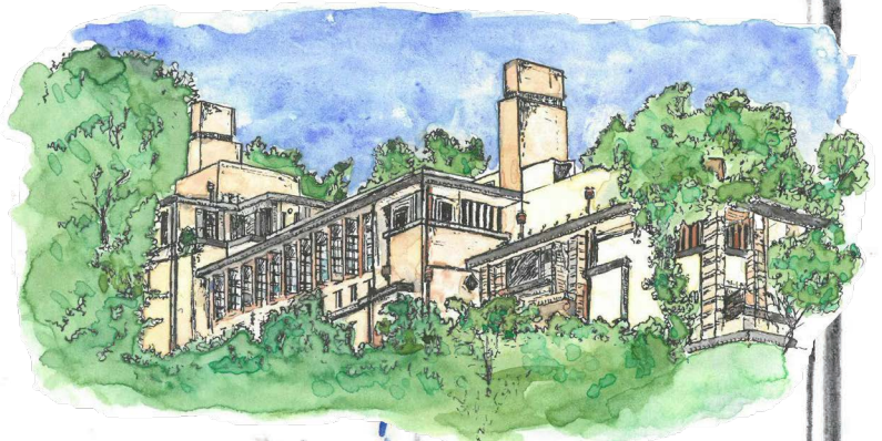
①旧山邑家住宅 (ヨドコウ迎賓館) →P.6~