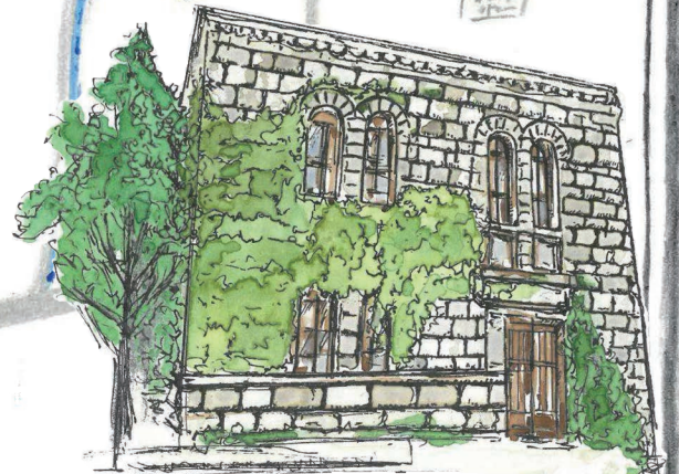
⑥旧松山家住宅松濤館 (市立図書館打出分室) →P.24~