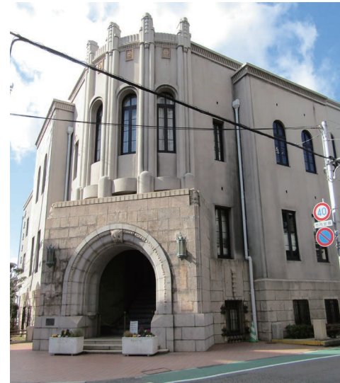
建て替えられた新庁舎に保存された旧庁舎の正面玄関