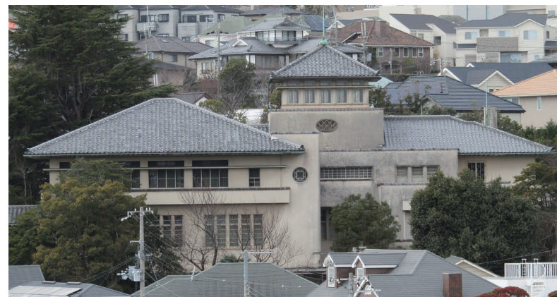
ヨドコウ迎賓館のバルコニーから見た滴翠美術館(東から)

瓦葺きの寄棟造りの屋根や、瓦を貼り付けたなまこ壁風の柱、瓦のこば積み壁など、近代的な建築の中に和の要素が取り入れられているのが特徴的。