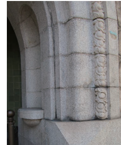
入口アーチ部分の彫刻