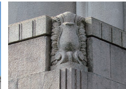
玄関上部隅の彫刻