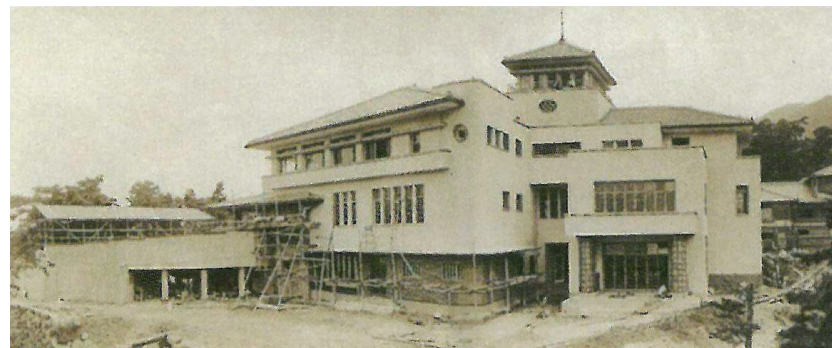
建設中の様子