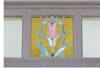
扉の上にある小さなステンドグラス