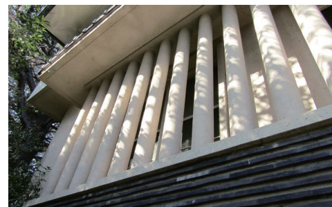
円柱状の面格子と瓦のこば積み壁

瓦葺きの寄棟造りの屋根や、瓦を貼り付けたなまこ壁風の柱、瓦のこば積み壁など、近代的な建築の中に和の要素が取り入れられているのが特徴的。