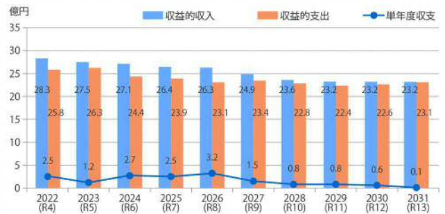
図3 収益的収支の推移