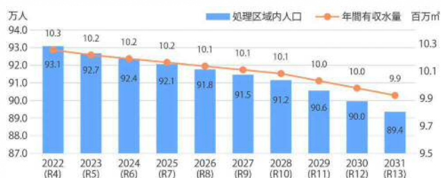
図1 有収水量と処理人口の推移