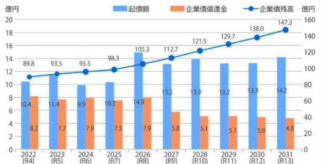
図5 企業債残高の推移