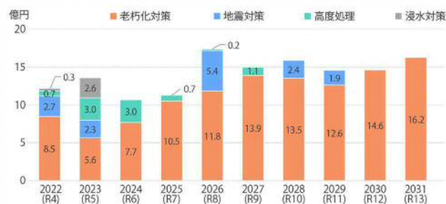
図2 投資計画における事業別金額の推移