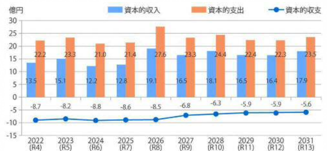
図4 資本的収支の推移