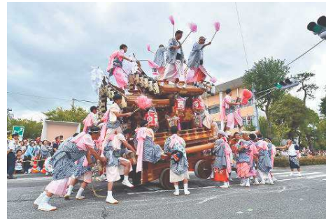
だんじりねり回し