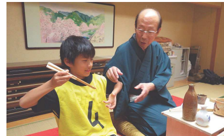
あしやキッズスクエア

学校園、家庭、地域が連携し、勉強や運動・文化活動、地域住民との交流活動等の取組を実施することにより、子どもたちが心豊かで健やかに育つ居場所や環境づくりを推進します。