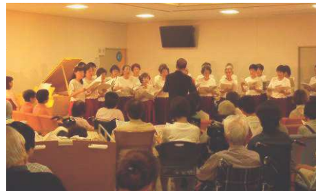
芦屋病院マチネーコンサート

市内全域で日常的に文化芸術に触れ、親しめる機会の拡充を図るとともに、自ら学んだ成果を発表する場や機会を提供し、社会へ還元する「知の循環型社会」を目指した仕組みづくりを進めます。