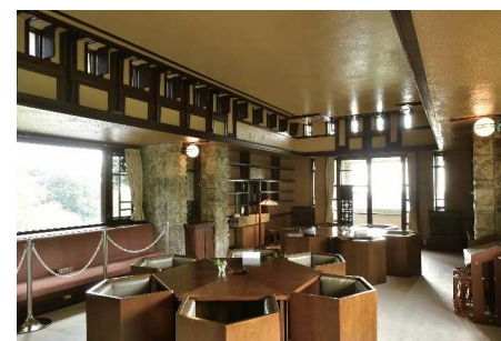
ヨドコウ迎賓館 内観

公園と周辺の地域や店舗などが連携した庭園都市ならではの一体的なまちづくりを進め、都会の中でも自然と触れあい、安らぎが感じられる、市民の誇りとなる芦屋の魅力の醸成を図ります。