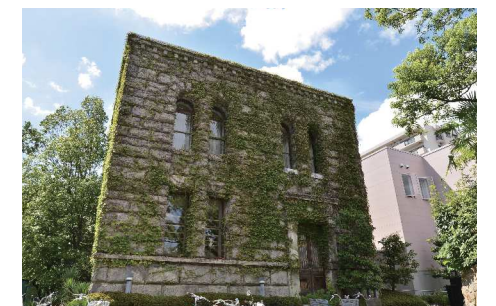
阪神間モダニズムを象徴する図書館打出分室

民間活力によるプロデュースなど、積極的なシティプロモーションに取り組むとともに、効果的な魅力発信のため、近隣市や大学等との連携により、まちづくり、教育、観光等との連携を強化します。