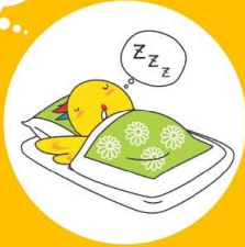
兵庫県マスコット はばタン