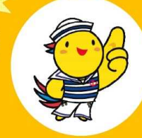
兵庫県マスコット はばタン