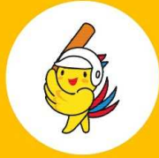
兵庫県マスコット はばタン