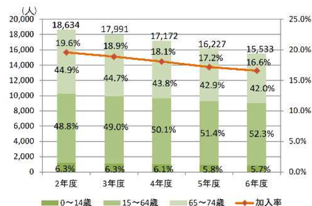
被保険者数及び加入率の推移 (各年度3月末)

被保険者数及び加入率は減少傾向が続いており、65歳以上の加入率は高止まりしています。