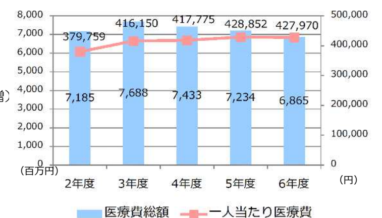
医療費総額及び被保険者一人当たり医療費の推移