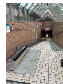
搬送コンベア機器④