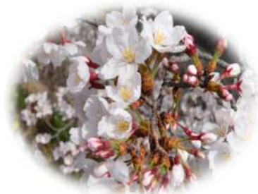
西宮市の市花 さくら