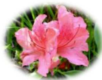
芦屋市の市花 コバノミツバツツジ