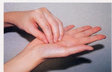
3. 指先、爪の間をよく洗う