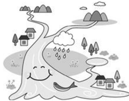
かんきょう 環境が良いまち

2) しょうらい 将来の かんきょう 芦屋市はどんな かんきょう 環境になっ ほ て欲しいと思 ほ いますか。(3つまでに○)