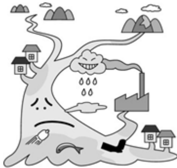
かんきょう 環境が悪いまち