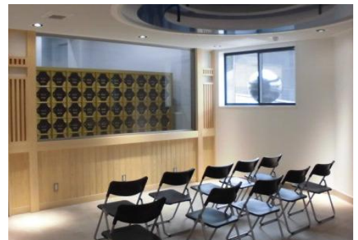
(手前)前室・(奥)一時安置室