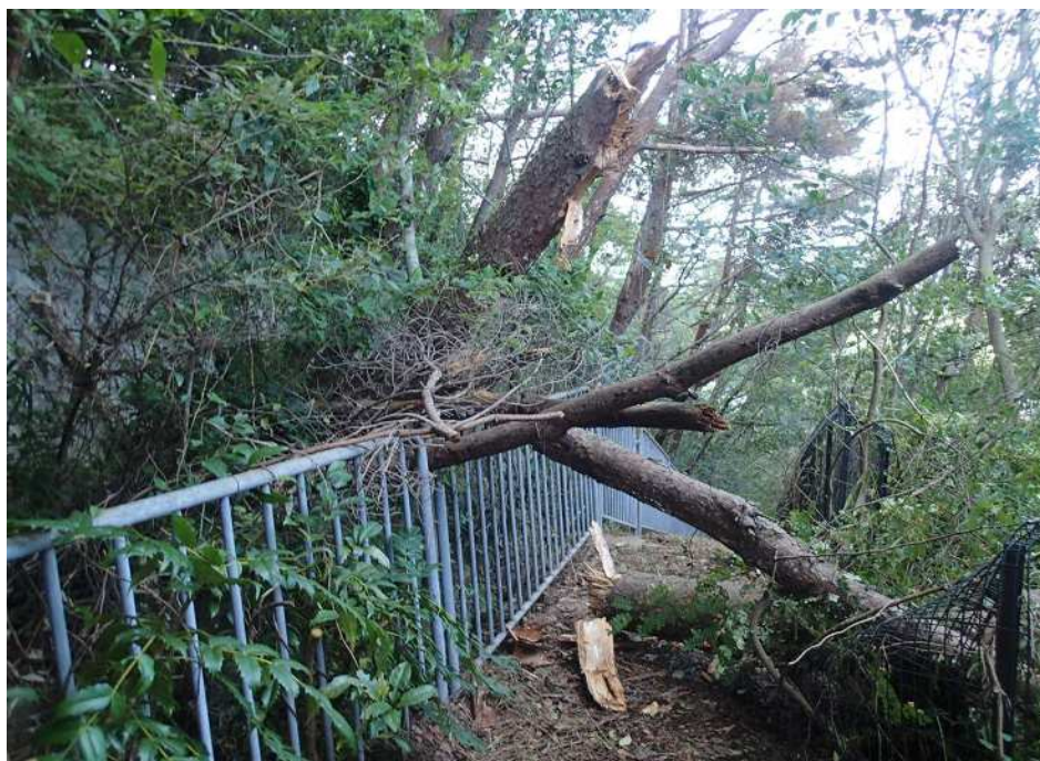
水路 下水道課管理用通路 民有地