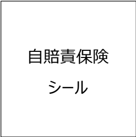
※自賠責保険シール実物大（参考）