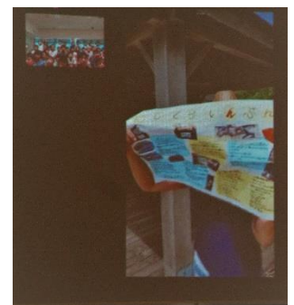
父島に届いたにしくら新聞

新聞を送った父島にいる元職員とテレビ電話を用いてリモート交流をする。画面に映った瞬間「おーい!!」と元気いっぱい手を振っていた。「元気」と聞かれると「元気!!」と答える。「新聞、届いたよ。ありがとう」と子どもたちがつくったにしくら新聞を、画面越しに見せてくれると「すごい」「ほんとに届いたんや」と喜ぶ。父島にいる天然記念物のムラサキオカヤドカリやココナッツ、サンゴを見せてもらったり、子どもたちの質問に答えてもらったりした。また「これはサンゴだよ。本当は海の中にいるんだけど、死んでしまったらこうなるよ」と白くなったサンゴを見せてくれた。そして「サンゴがいつも海をきれいにしてくれているから、父島の海はきれいなんだよ」と教わった。