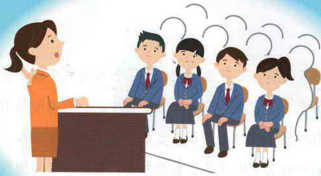
犯罪被害者遺族による講演