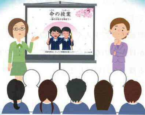
相談員によるデジタル紙芝居