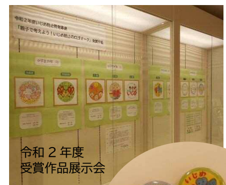
受賞作品の缶バッチを、参加賞として配付しました

芦屋市の皆さん、すべての子どもがいじめの加害者にも被害者にもならないよう、いじめを生まない土壌づくりに向けて、いじめの未然防止・早期発見にご協力ください！