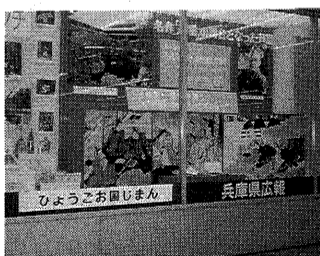
県の広報ショーウィンドー(神戸市)でPR

記念館には、市内からだけでなく、全国各地からも見え、また、外国でもファンが多い谷崎文学らしく、外国人のかたも見えています。今年の七月、市内在住のニコラス・マツカーシ英国総領事が夫