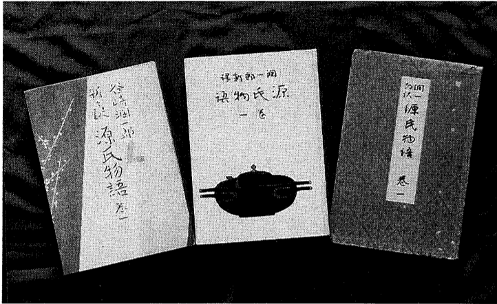
最初の訳(右)は、昭和10年に打出の家で執筆にかかり4年間打ち込み、新訳(中)も昭和25年から4年間執筆、さらに新々訳(左)は昭和39年に着手して刊行完了したのは死後3カ月を経た昭和40年10月でした。

特別展では、三度にわたって行った『源氏物語』の現代語訳の業績が一堂に展示され、原文と谷崎訳の対訳や、旧訳・新訳・新々訳の訳文比較がで