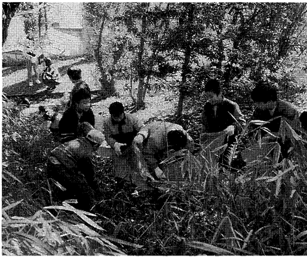
美しい春の花のために、会下山で落葉拾い(浜風小学校)

ある心豊かなやさしい子を育てる道徳教育」をテーマに研究を進めてきた。今まで進めてきた、「考える子」「やさしい子」「はたらく子」「がまん強い子」の4つの研究のうち