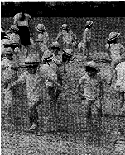
今日は海辺で保育(精道幼稚園)

「自ら取り組む学習」を「ひとり勉強」と名づけて、開校以来十余年間継続して研究を進めてきています。今年、十一月十日